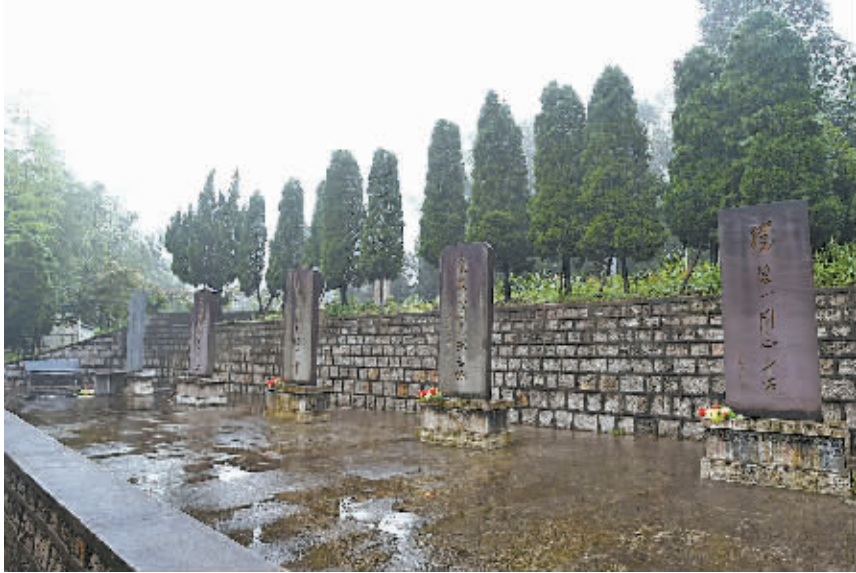
梁弄镇革命先辈碑林。