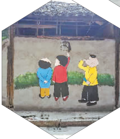
宁波大学学生创作的墙绘。