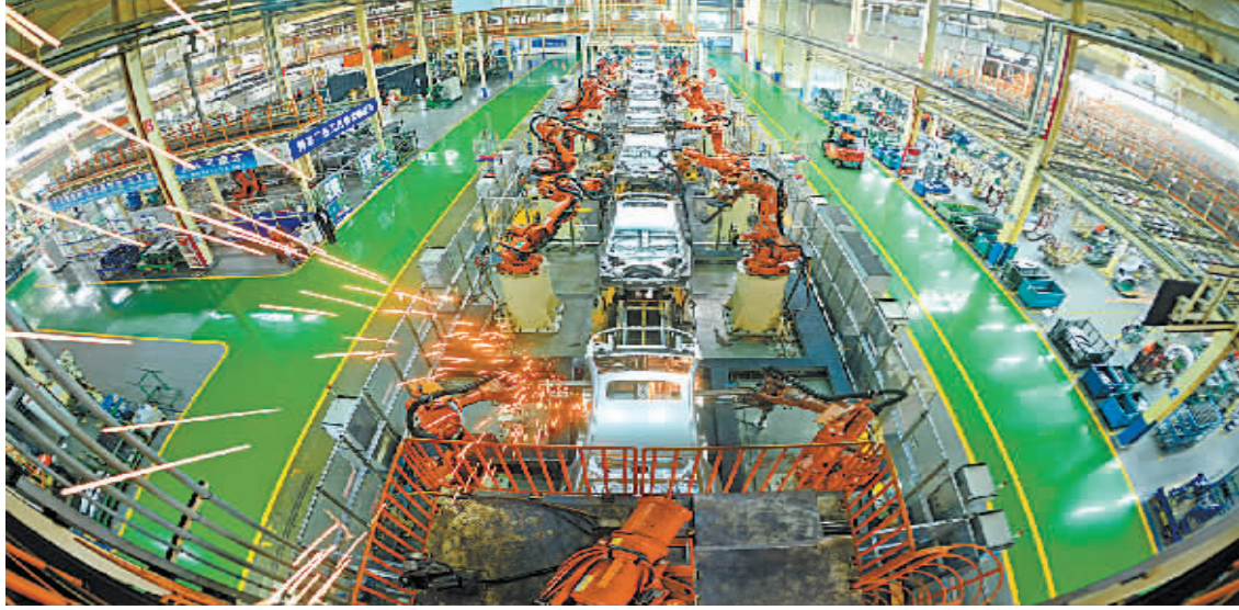
图为吉利汽车杭州湾基地生产线。