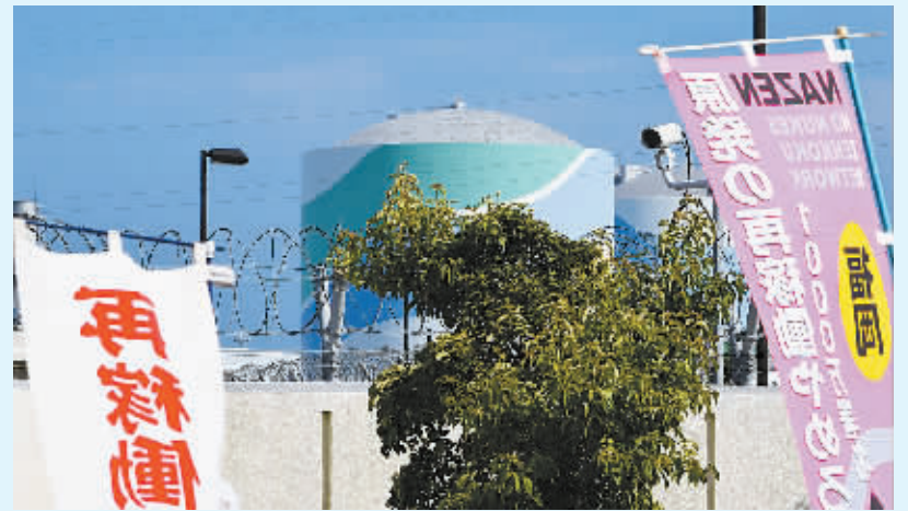
这是8月11日在日本鹿儿岛县萨摩川内市拍摄的川内核电站反应堆。

新华社东京8月11日电（记者蓝建中）日本九州电力公司11日宣布，川内核电站1号机组当日成为日本全国首座被审查符合新安全标准后重启的反应堆，日本由此结束了1年11个月以来的“零核电”状态。