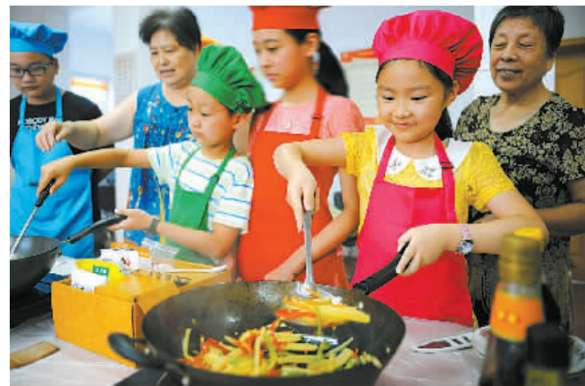
昨天,江东明楼街道明南社区举行“学烧家常菜 动手又快乐”活动。孩子们在“老宁波”的指导下学习烧制家常菜,既培养了少年儿童动手能力,又增添了无穷乐趣。