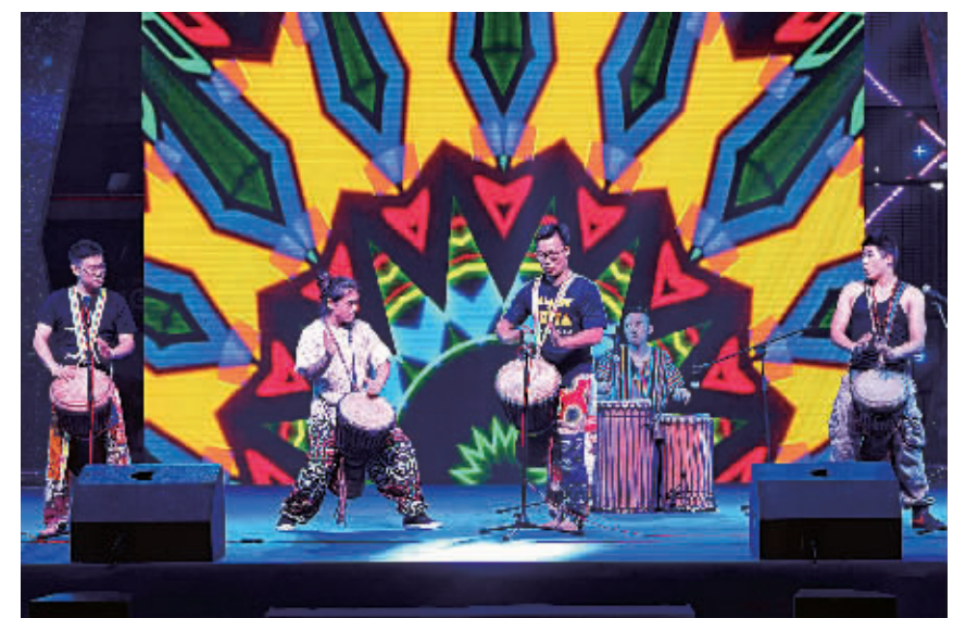
购物节闭幕式上的开场舞《非洲鼓》。

释放电子优惠券7万张,使用承兑5万张,承兑率70%,远高于互联网营销平台平均水平。银联和23家参与活动的商业银行共让利1500余万元。市六区商文、商体、商旅、商银互动,线上线下并举,共安排活动近300项。商家参与热情高涨,推出了近年来少有的优惠促销政策。天一广场、和义大道、世纪东方、鄞州万达、印象城、奥特莱斯、联盛广场、江北万达、来福士、北仑富邦世纪、镇海海海商业广场等十几个大型商业广场全程参与,打造了区域辐射广、时间持续长、内容极其丰富的购物盛宴。