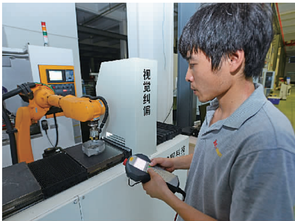
图为技术人员在调试机器人。