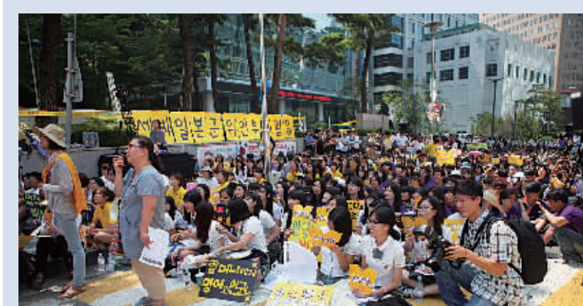
韩国民众举行集会 要求安倍承认侵略历史 8月12日,韩国民众在位于首尔的日本驻韩大使馆前举行示威活动,强烈要求日本首相安倍承认侵略历史。

日本驻韩国使馆上一次遭遇自焚事件是在2005年。当时,一名54岁男子因抗议日本宣称对独岛(日本称“竹岛”)拥有主权而在日驻使馆前自焚。