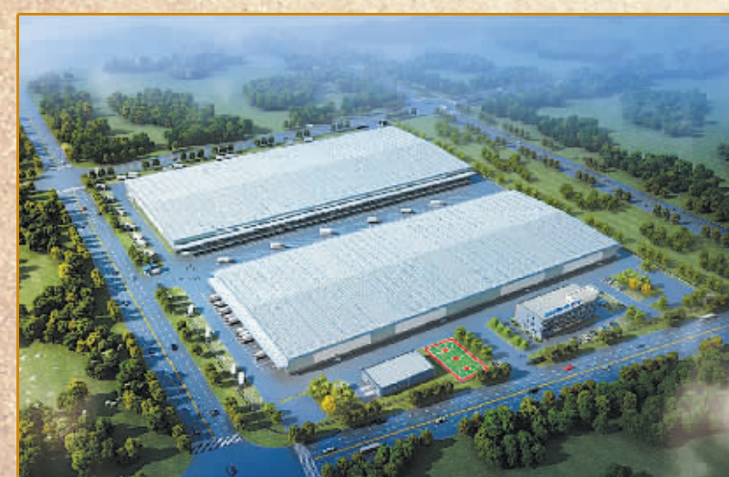
苏宁宁波地区电子商务运营中心

由宁波市属国有企业——宁波市商贸集团有限公司投资。项目总用地508亩,总投资15亿元,已列入2014年省重点投资项目,是宁波中心城区的迁建项目、菜篮子工程,将建成以蔬菜、水果、肉禽蛋、副食品等农副产品为交易重点的物流中心,包括交易区、理货加工配送区等功能区域。目前,项目已完成注册、道路运输许可证等手续,注册资金3亿元,首期出资6000万元;已完成备案、规划选址等前期工作及勘察设计招投标、规划设计方案,计划今年开工,首期进驻306亩。该项目的建成投产对于提升宁波中心城区的专业市场,带动区域商贸、餐饮住宿、交通运输等发展,增加地方财政收入,促进地方经济发展具有重要意义。