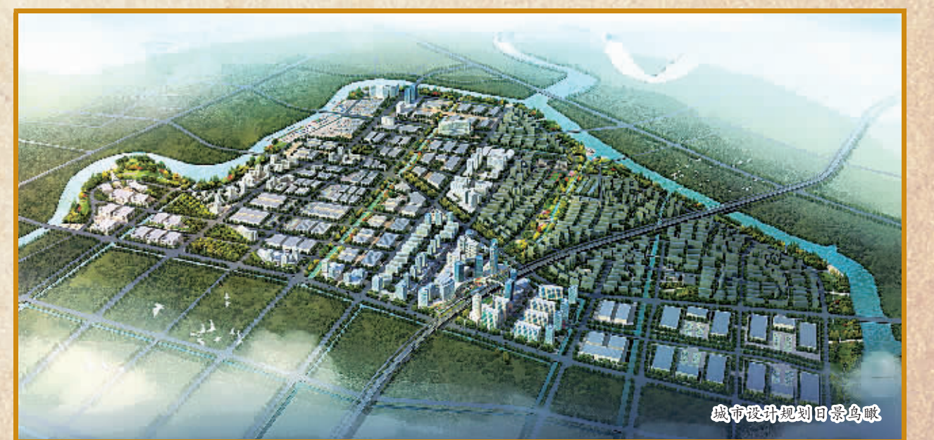
中建设计规划日照效果图