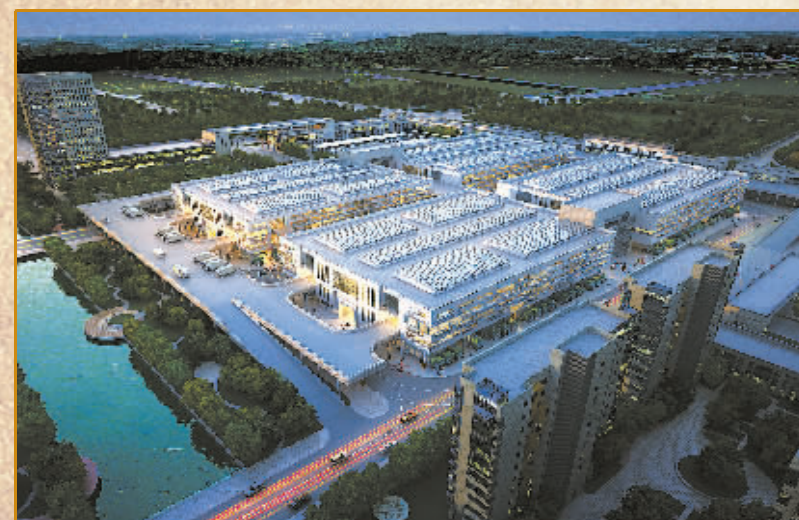
宁波农副产品物流中心

6月9日上午,在第十七届中国浙江投资贸易洽谈会重大项目签约仪式上,深国际·宁波综合物流港项目正式签约落户宁南贸易物流区。由上市的国有红筹公司——深圳国际控股有限公司投资。项目总用地290.6亩(一期137.7亩,二期152.9亩),总投资1.13亿美元,已列入2014年省重点投资项目。总体定位为物流功能平台和产业链服务平台,结合完善的服务设施;以发展城市配送、提高配送效率为目标,面向宁波及周边地区,拟建设成为宁波市面向百姓生活、提高城市运行质量的配送服务基地;集城市配送、干线运输、现代仓储以及产业链服务等功能于一体的综合物流港。目前,项目建议书、规划设计方案初稿已完成。根据计划,一期项目将于2015年底开工建设,预计2017年底竣工投产。