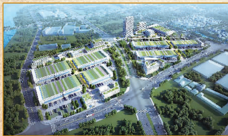
深国际·宁波综合物流港