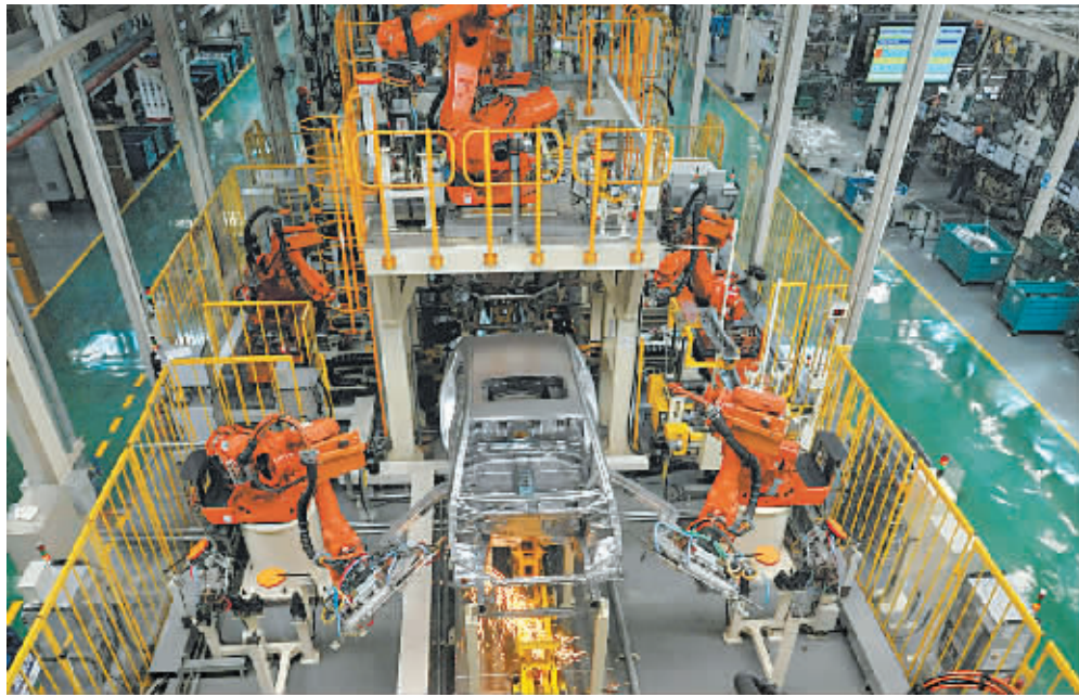
吉利自动焊接流水线。