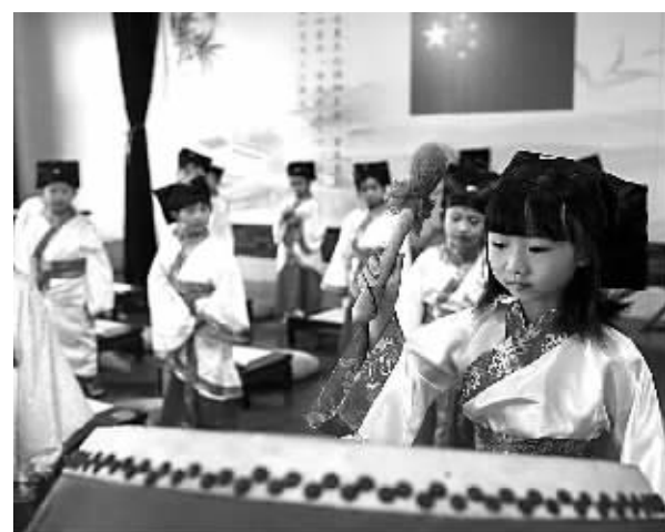
昨天上午，北仑区霞浦街道上傅社区在文化礼堂举行2015年“开笔礼”，近20名即将上小学的孩子迎来开学前重要一课。一系列仪式后，老师为孩子们上了一堂道德课。老师还给每个孩子送上了一只喜蛋和一支毛笔，寓意孩子们将来能取得优异的成绩。图为孩子们正在参加开笔礼。

沈天万是宁波人，师承刘海粟、关良等艺术大师。前不久，沈天万来宁波同心书院观看刘海棠的展览，使他萌生了回自己故乡办画展的想法。这次沈老带来了他的代表作《霸王别姬》《吕布戏貂蝉》《白蛇传》《徽州》等。