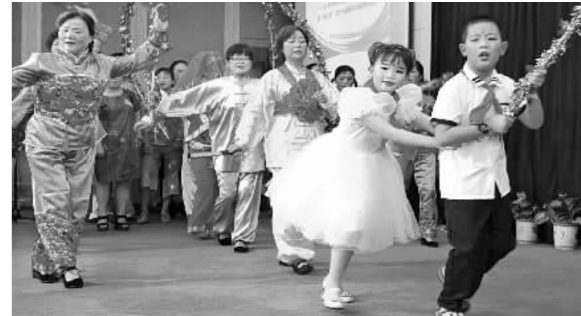
近日，海曙区鼓楼街道举行“朝夕相伴，爱满鼓楼”暑期活动闭幕式暨“海之梦”青少年暑期社会实践表彰会。