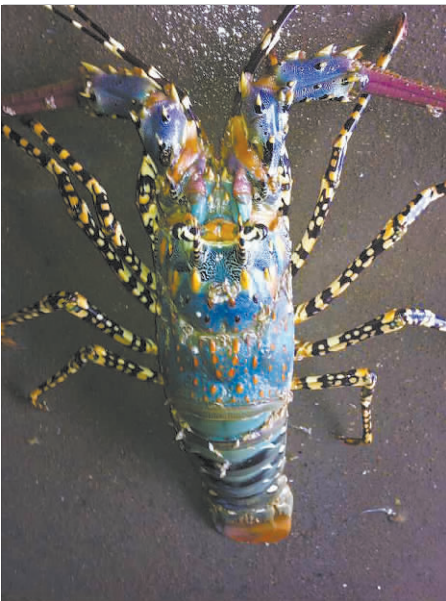
象山渔民捕获罕见 『锦绣龙虾』

昨天下午,在海曙区西门街道体育场路30弄9-12号老小区内,居民行走在刚搭建好的便民桥上。为应对因大雨引起的低洼地段暂时积水状况,该街道在龙柏社区低洼地段修起一条长150米、宽0.6米的固定式混凝土便桥,既方便居民出行,也可供人们在平时作休闲纳凉之用。据悉,该街道还将在西湾路、新芝路等低洼地段逐步推广实施。