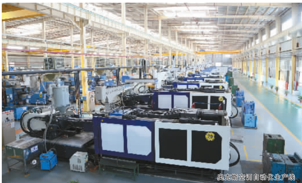
奥克斯空调自动化生产线

宁波历年“全国民营企业 500 强”入选企业数量均在 20 家左右。“由于企业自愿参加上规模民营企业调研，因此历年入围企业数量会有波动。”市工商联相关负责人介绍，2015 年入围“全国民营企业 500 强”19 家，其中有 16 家民营企业连续三年入围。从行业来看，