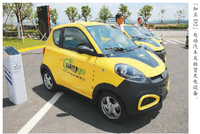
知豆电动汽车有限公司宁海生产基地展示的“知豆D2”电动汽车及租赁充电设备。

据了解，这次投入的车型为今年6月最新上市的“知豆D2”，充满电需6、7小时，最高车速为80公里/小时，以45公里/小时匀速行驶时的续航里程为210公里。首批推出的8个租赁网点能基本解决租赁点之间异地还车的问题。