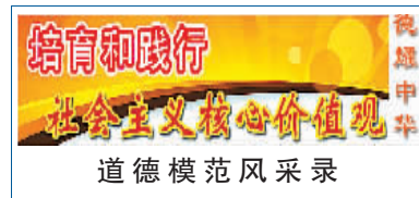
□本报记者 陈敏 海曙记者站 张立

【人物名片】陈爱国，男，1954年出生。1992年12月2日晚，妻子突遇车祸而瘫痪。为照顾妻子，身为一桥梁公司副总经理的陈爱国辞职当起“保姆”，日夜守在妻子身边，这一守就是20余年。2013年，他被宁波市精神文明建设指导委员会评为“宁波好人”，2014年入选浙江好人榜。