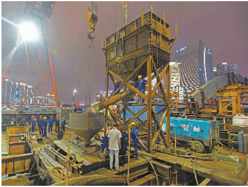
图为灵桥施工现场。

步骤变得更加复杂。因此，灵桥维修工期较预期延长，预计明年2月底前完成拱肋合龙。这位负责人说，参建各方将继续加快工程进度，争取早日完成灵桥大修工程。 这位负责人还说，老桥维修不同于新建工程，其复杂性和困难性都大大超过了预期，不少问题需要在维修过程中一边发现一边解决。如在拱肋拆卸后发现，拱肋的尺寸情况、内部构造、拱轴线位置与原设计方案存在较大出入，变形、锈蚀等病害情况也较预期严重。为此，设计单位用两个多月时间对设计图纸进行了修改调整。种种因素叠加，最终导致灵桥大修工期滞后。 另据了解，于2013年6月10日建成通车的灵桥便桥，其设计使用年限为两年，随着灵桥大修工程工期滞后，其服役时间也随之延长。城管部门相关负责人表示，今年上半年，已安排专业的桥梁检测单位对灵桥便桥安全运行状况进行了检测，确定仍满足现状的使用要求，请广大市民放心通行。