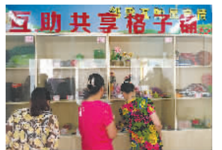
居民在“格子铺”挑选义卖品。

抽水泵、强力手电筒、通管道钢丝器、各类工艺品……昨天一早，海曙南门街道郎官社区的居家养老中心，在经过一个月的“试营业”后，“格子铺”正式开张，前来捐献和借用物品的居民络绎不绝。