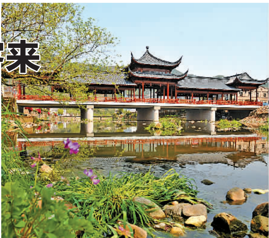
新建成的廊桥成为当地一景。

为此，白沙街道在活动推出前，专门对辖区内5个社区进行了民意调查，了解百姓需求。经过一个月的调查，发现眼科检查、家庭教育、心理咨询、小家电维修和生活用品维修成了居民的普遍需求。