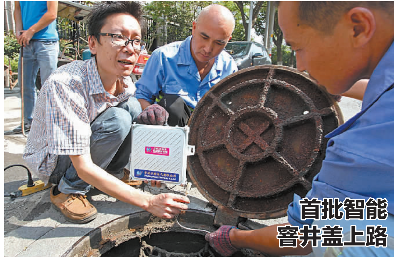
首批智能窨井盖上路

日前,我市两家基层检察院对近年来受理的知识产权类案件进行了统计分析,发现其最明显的特点就是涉案罪名相对集中。以市一家基层检察院为例,在该院2010年至2014年受理的侵犯知识产权犯罪案件中,侵犯著作权罪和销售假冒注册商标的商品罪两个罪名,占据了总数的91.6%。而侵犯商业秘密罪、假冒专利罪等由于取证、认定极为困难,实践中侦破难度也相当大。