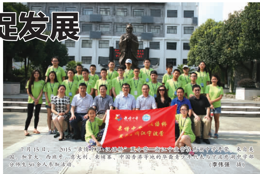
7月15日，2015“亲情中华·双语桥”夏令营—浙江宁波营在慈湖中学开营。来自美国、加拿大、西班牙、意大利、柬埔寨、中国香港等地的华裔青少年代表与宁波慈湖中学部分师生50余人参加活动。

近年来，市侨联依托“法律顾问委员会”的两个法律工作援助站，为广大归侨侨眷和海外侨胞在国内的合法权益提供法律保障和法律服务，据统计，今年上半年两个法律服务工作站共接待受理涉侨咨询、代理服务250余件。市侨联还坚持在传统节日开展“送温暖、献爱心”，协助党委、政府做好侨界弱势群体的“帮扶济困”工作。近五年来，全市各级侨联累计向2600余人次困难归侨侨眷、留学人员家属和结对帮扶困难户送上慰问款（物）计255.53万元。