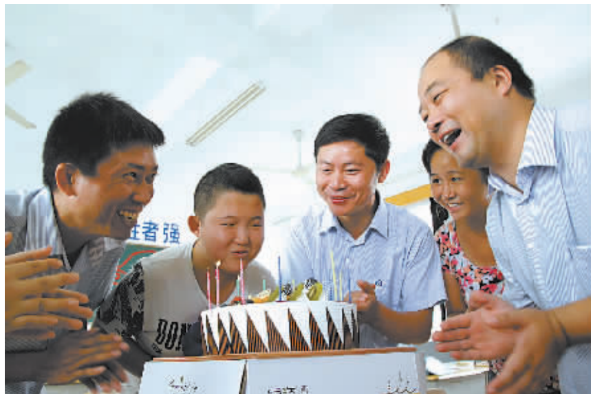
图为公交“爸妈”为结对学生庆祝生日。