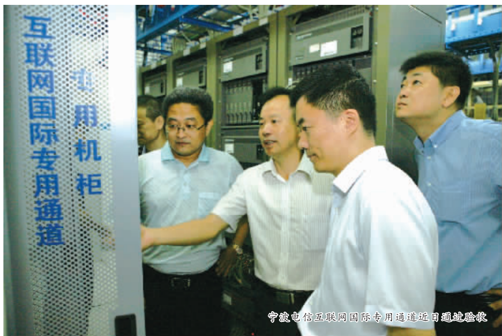
宁波电信互联网国际专用通道近日通过验收

依托于强大的光纤通信网络，中国电信在全国建立378个云数据中心，形成了“8+2+X”