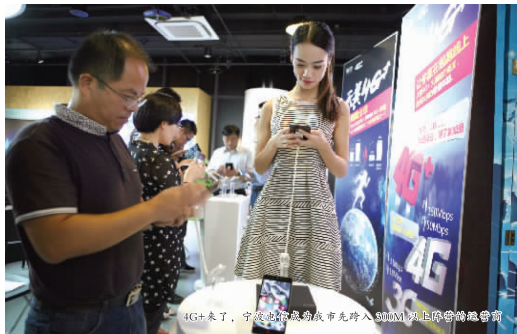
4G+来了，宁波电信成为我市先跨入300M以上阵营的运营商

从今年9月至年底，中国电信还将陆续推出千元机、三星S6等高端明星机在内的30余款终端。预计2016年将超过80款“天翼4G+”手机上市，以更好地满足用户的“尝鲜”需求。