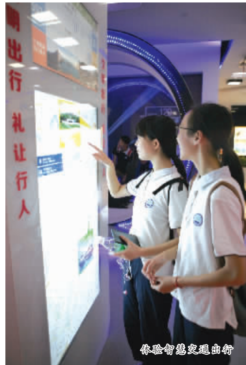
体验智慧交通出行