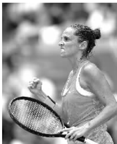
9月11日，意大利选手芬奇在比赛中庆祝得分。