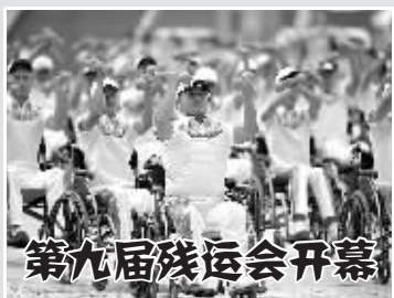
9月12日，中华人民共和国第九届残疾人运动会暨第六届特殊奥林匹克运动会在四川省成都市开幕。

9月11日，在加拿大多伦多，英国女演员蕾切尔·薇兹出席影片《龙虾》首映式。当日，第40届加拿大多伦多国际电影节进入第二天，马特·达蒙、桑德拉·布洛克与蕾切尔·薇兹等影星先后亮相，电影节的红地毯上“星光”灿烂。