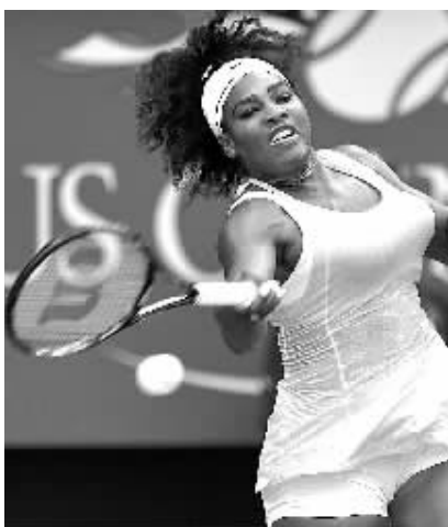
9月11日，小威廉姆斯在比赛中回球。