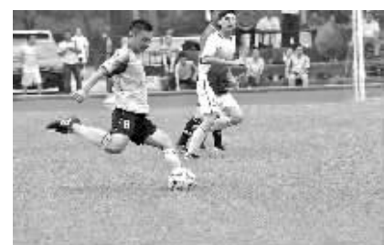
图为比赛中的镜头。