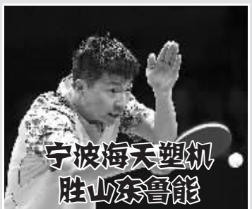
9月12日，宁波海天塑机俱乐部选手马龙在比赛中。当日，在2015中国乒乓球俱乐部超级联赛男子团体半决赛中，宁波海天塑机俱乐部以3:0战胜山东鲁能俱乐部，进入决赛。