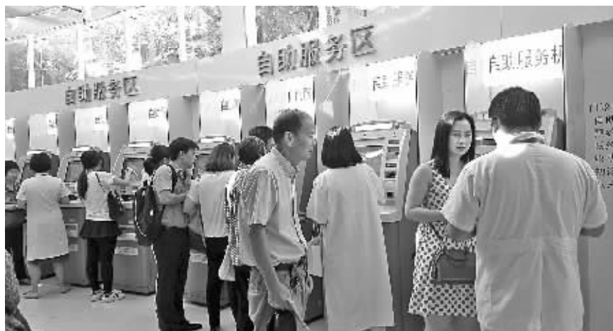
好多看病者在一院医生的指导下,尝试“互联网+”给缴费带来的便利。

本报讯(记者张正伟)周末,记者来到市一院,发现大厅里挂号窗口前的“长龙”少了、短了,倒是许多看病者在一些机器前操作着什么。记者走上前去一探究竟,原来这些机器是医院正在推行的智慧医疗支付结算自助机。看病者只需在这些机器上刷下身份证,设置密码并留下联系电话,便会获得一张带有储值功能的就诊卡,使用现金或银行卡在自助机上充值后,便可缴纳挂号费、诊疗费、药费等,不需再到窗口排队。