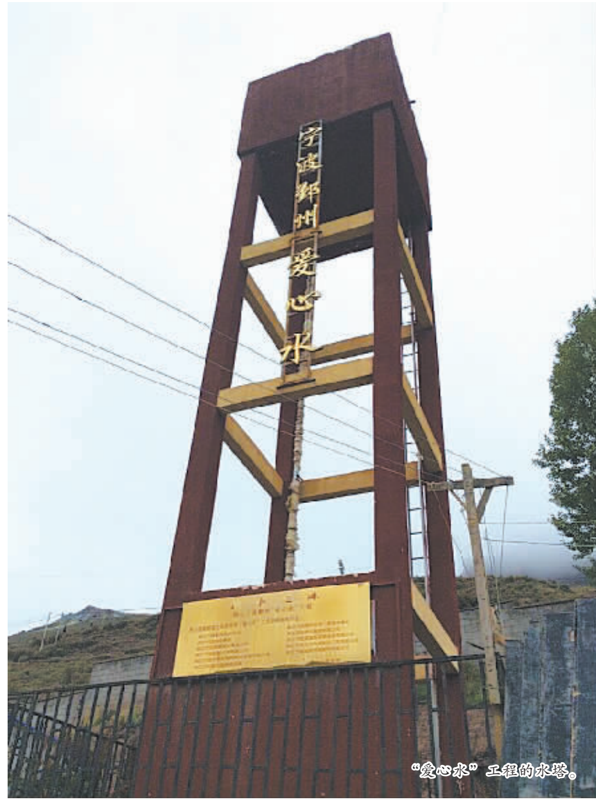
“爱心水”工程的水塔。

努力改变这个现状的是一批批来自宁波的援藏干部。“教育是一个地方发展的根本”,从第一批援藏干部开始,这个理念就开始在这里扎根发芽。20年间,在一笔笔援藏资金的支持下,各个乡镇的希望小学陆续建立,一幢幢教学楼拔地而起,一系列教学设施