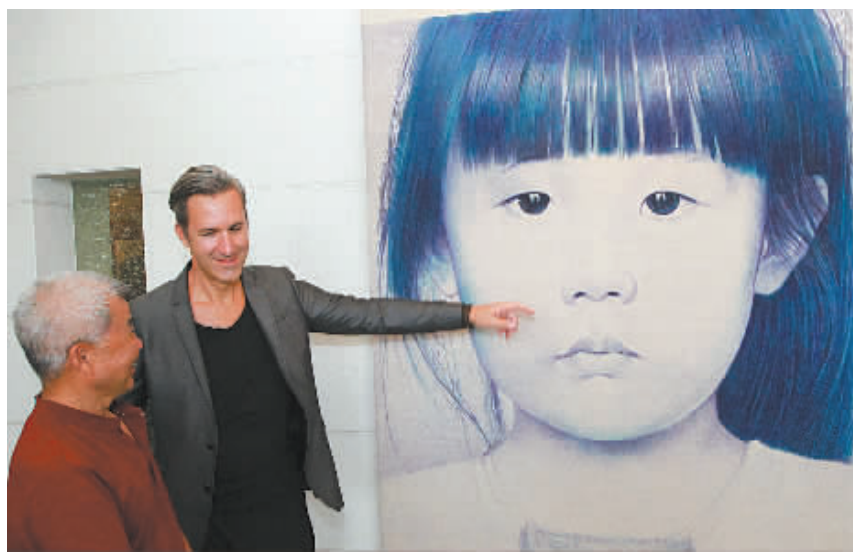
图为意大利画家(右一)向参观者讲解自己创作的水墨画作品。

意大利艺术家通过此次活动了解宁波，佩纳齐的雕塑《甬江上的多姆斯》运用了镜子、玻璃、沙子、海盐、玫瑰花瓣等，体量巨大引人注目。“多姆斯在拉丁语中是房子的意思，作品描述的是甬江两岸人们的生活。这不是传统的以大理石等制作的雕塑，我在出发前和宁波方作了很多交流，了解宁波的方方面面。”