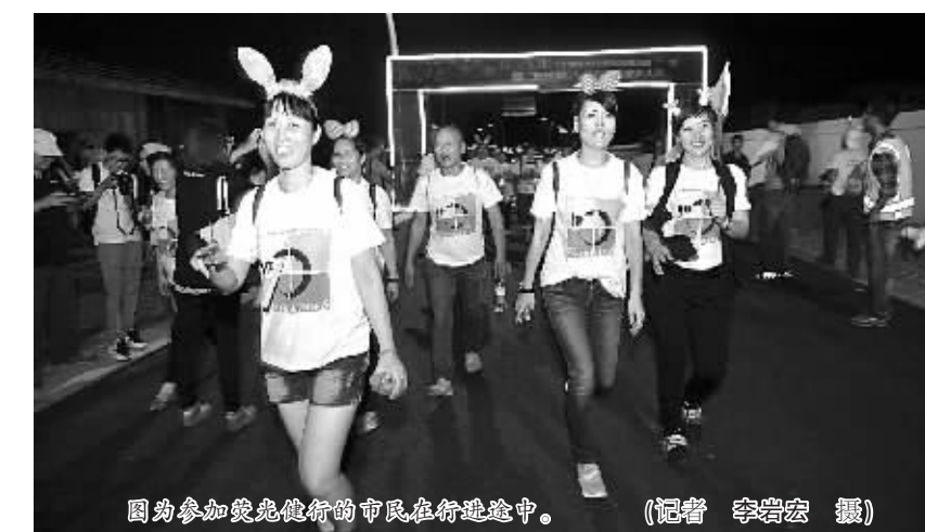
图为参加荧光健步走的市民在行进途中。