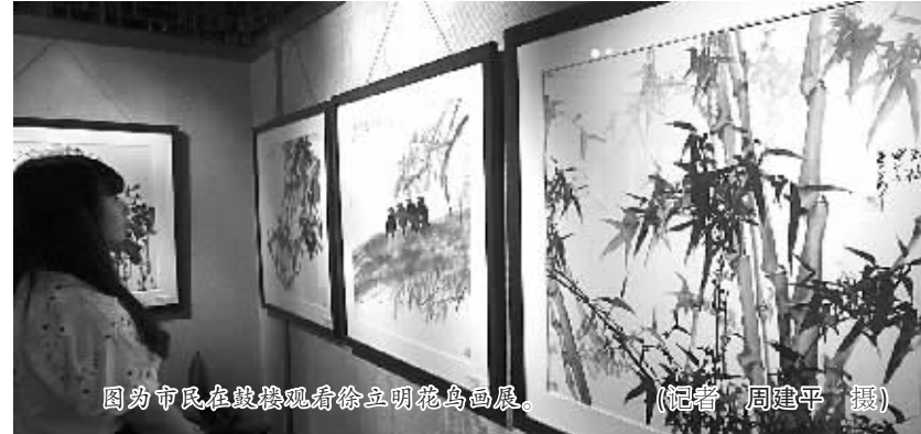
图为市民在鼓楼观瞻徐立明花鸟画展。

写意，还有浓重装饰味的点、线、面的组合等，反映了徐立明广泛的艺术追求和内心的深度思考。多年来，徐立明始终遵循着“外师造化，中得心源”这一中国画的创作原则，作品中随处可见他对事物敏锐的观察力和笔墨概括能力，如富有立体感和质感的葡萄，形象生动角度不同的葵花，姿态各异栩栩如生的鸭子，色彩明快浓淡不一的山花等。据悉，展览将持续至27日。