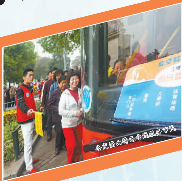
公交登山特色专线服务市民