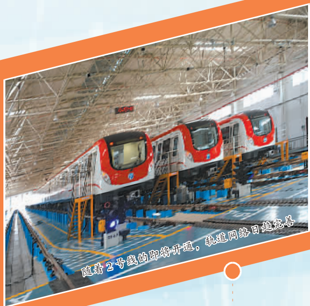
随着2号线的即将开通，轨道交通建设将