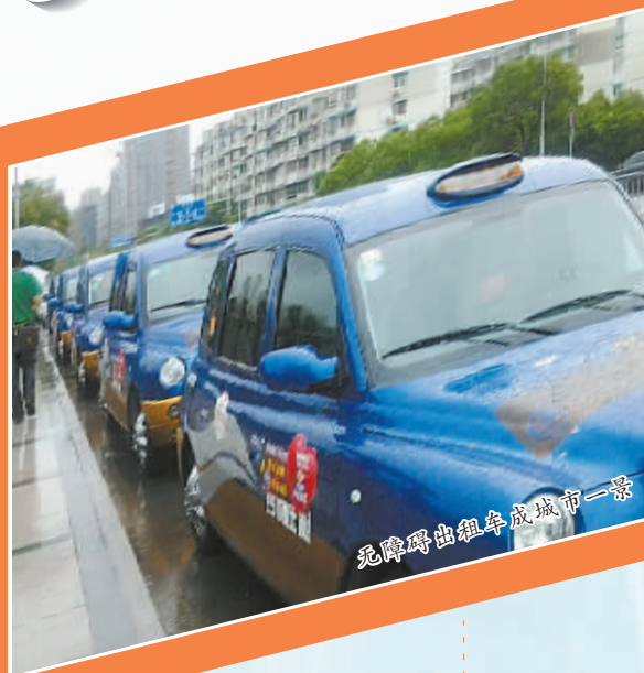
无障碍出租车成城市一景