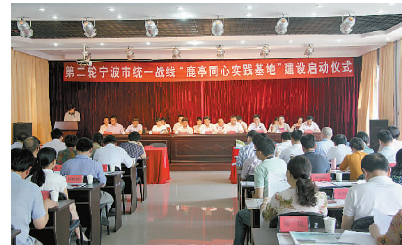
新一轮宁波市统一战线“鹿亭同心实践基地”建设日前启动。

（台）资企业捐助“五水共治”项目资金9亿元。深入推进宁波市统一战线“鹿亭同心实践基地”建设，自2012年以来，共启动美丽乡村建设、基础设施建设、民生帮扶工程、合作招商工程四大类61个项目，累计捐建实体类公益项目资金820余万元，扶贫帮困220余万元；引进项目总投资2亿元，受惠群众6000余人次。该基地建设有力促进了鹿亭乡经济社会发展，去年该乡农民纯收入达12954元，同比增长17%。启动“同心甬商回归”行动，据统计，2014年全市各级统战部门牵头签订海外合作项目（意向）142个，服务引进项目64个，合同引进外资94.5亿元，实际引进外资24.78亿元。发挥港澳台海外“宁波帮”优势，近两年，牵线引进海外捐赠项目223个，合计9000余万元。市工商联顺应形势发展，积极探索商会承接政府职能转移取得新突破。