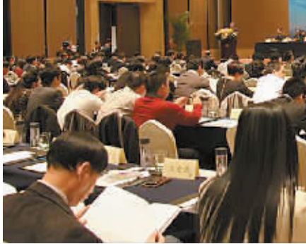
宁波市“创二代”联谊会成立。

发展“微组织”，以整合社会资源，建立常态机制。该区成立区、街道（镇）、社区（村）三级民族工作领导小组，23家区级部门、9个街道（镇）组成的少数民族工作协调小组，统筹全区民族工作。推行1个区民族团团结促进会、9个街道（镇）分会、N个社区（片区）、农村、企业、学校）联谊小组，以及多个民族社团组成的少数民族“1+9+N”四级组织网