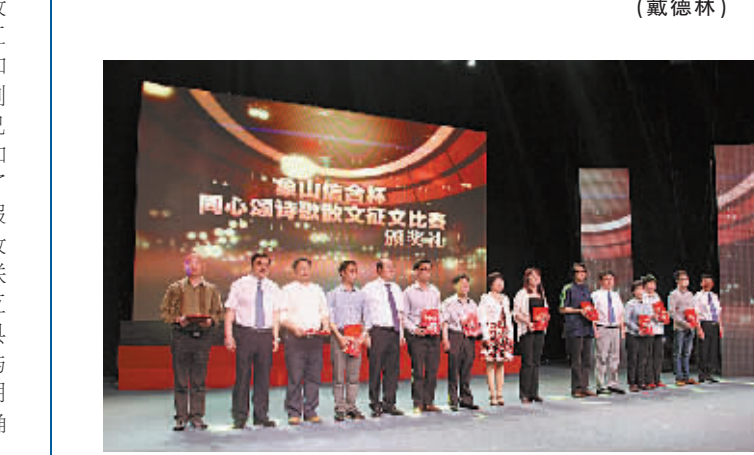
象山信合杯同心颂诗歌散文征文比赛举行。

2011年以来，余姚市顺应社会发展新变化，把基层协商民主制度化、规范化、程序化“三化”建设，作为新时期践行群众路线、转变决策施政方式、推进社会协商共治的重要环节，取得了较大成效。目前，余姚市各乡镇（街道）、大部分村（社区）、部分企业和商会已基本建立贴近实际、富有成效的党群政民互动协商机制。