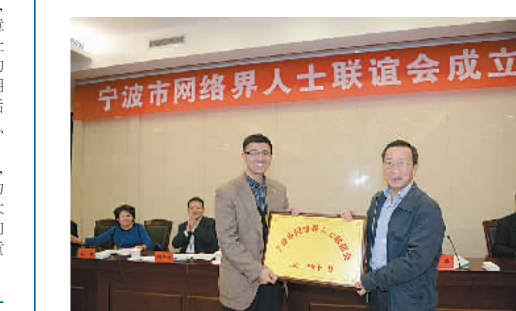
宁波市网络界人士联谊会成立。

健全两岸交流机制。2008年，《象山县与台东县建立交流合作关系备忘录》正式签订。2010年，达成象山县农渔业科技人员赴台技术培训的意向。2011年，首次由象山、台东双方共同举办“海洋经济合作交流”，就拓展两岸农渔、旅游等方面合作进行深入交流。活跃文化交流。每届“中国开渔节”，石浦民众和台湾台东县富冈新村都开展庄严、隆重的妈祖如省亲迎亲、“妈祖一如意巡安”和两岸渔民祭海仪式等活动。拓展经贸交往。成功创建浙台（象山石浦）经贸合作区，投资2亿元建成海峡广场，引进台商联合开发的台湾商贸城；改造提升新港对台贸易专用码头，建成华东地区最大的对台小额贸易物流基地；加快台湾石斑鱼进口暂养基地建设，进而引进台湾技术人员入驻发展育、养、销产业；承办“2014年两岸渔业产业项目合作对接会”，成功创建浙台（宁波象山）渔业合作示范区。2015年3月，国台办、国家农业部批复同意在象山设立浙江省首个海峡两岸渔业合作基地。（林鹏程）