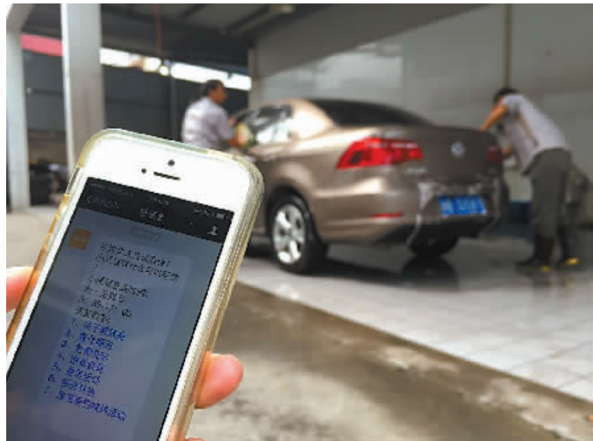
在宁波，越来越多的私家车主正享受“互联网+汽车”带来的增值服务。

在兴宁路一家汽车4s店内，25岁的女白领程菲将轿车驶入车辆清洗处。她打开微信，熟练地点进“轿辰会”微信服务号，选择免费洗车服务。只要手机与平台绑定，就能免费洗车5次，这样的好事何乐不为？