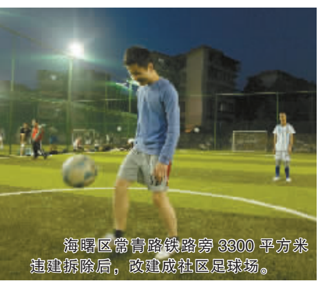
海曙区常曹路铁路旁3800平方米违建拆除后，改建成社区足球场。