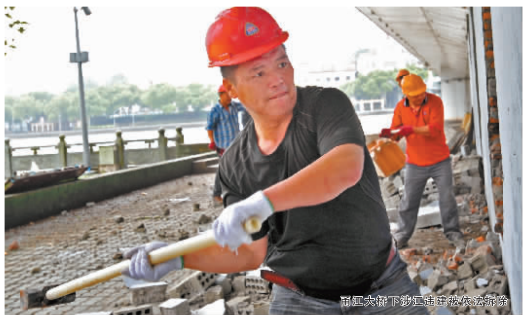
甬江大桥下涉江违建被依法拆除

目前，“两路两侧”专项整治工作已取得明显成效。通过自我排查、自我施压，对“两路两侧”及1000米可视范围内的环境问题进行彻底排查，新排查出市级环境问题点2365个，确保不留死角、不留盲区；在整治乱搭乱建、乱堆乱放等问题的基础上，我市新增公路干线维修养护缺失问题的专项治理内容，力求以高标准的点源整治，以点带线，以线促面，努力营造纵横全市覆盖城乡的美丽景观带。整治工作的长效保障机制也已全面建立，为防止问题反弹回潮，各地政府负责人担任“路长”、“段长”，同时建立了网格化的巡查制度。