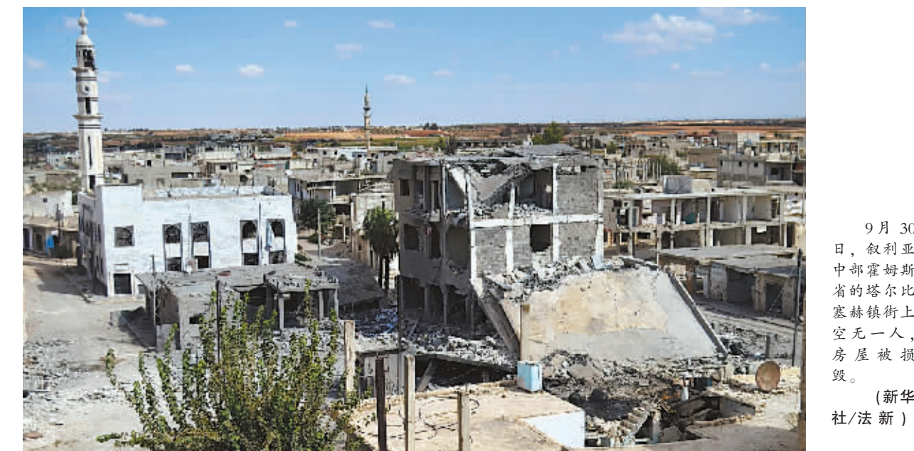
9月30日,叙利亚中部霍姆斯省的塔尔比塞赫镇上空无一人,房屋被损毁。

俄罗斯联邦委员会(议会上院)9月30日上午批准总统在国外动用俄武装力量。仅隔6小时左右,俄空军就在叙利亚空军的配合下,首次对叙境内的极端组织目标实施空中打击。俄国防部发言人当晚说,俄空军航天部队出动约20架次飞机对极端组织“伊斯兰国”在叙境内8处地面目标实施空袭,打死数十名武装分子,并摧毁大量军事设施及武器装备。 俄罗斯此前多次宣称向叙政府提供军事援助和技术支持,并增加在叙利亚的军事存在,此次空袭标志着俄首次直接军事介入叙利亚。虽然西方国家一直对俄罗斯的真实意图心存疑虑,但俄此次主动出击师出有名,不仅是对国际反恐行动的极大支持,也有助于加强自身在叙利亚和中东地区的影响力。 首先,西方和俄罗斯在叙问题上的立场发生微妙变化,为俄直接军事介入提供可能性。俄总统普京和美国总统奥巴马在联合国大会会议期间举行会谈,就协调打击“伊斯兰国”取得共识。分析人士认为,美国默许俄罗斯的空袭是本次“普奥会”的成果之一。 美国等西方国家此前一直要求叙总统巴沙尔立即下台,认为只有他下台才能解决叙利亚问题,而现在则考虑在他下台前进行政治过渡。而俄方虽然依旧力挺巴沙尔,但也不反对在叙利亚进行政治改革。在这种微妙变