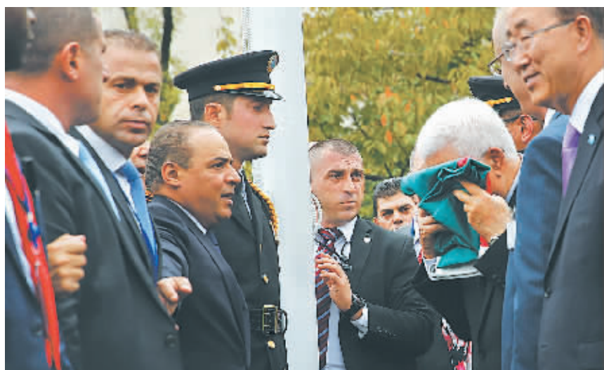
巴勒斯坦国总统阿巴斯在升旗仪式上亲吻巴勒斯坦国旗。

据新华社联合国9月30日电 纽约时间9月30日下午1时16分,巴勒斯坦国旗第一次飘扬在纽约联合国总部。 巴勒斯坦国总统阿巴斯在联合国总部玫瑰园举行的升旗仪式现场说:“我对全世界的巴勒斯坦人民说,请高举起巴勒斯坦的旗帜,因为它是巴勒斯坦人身份的象征。” 进行了简短的发言后,阿巴斯深情亲吻了巴勒斯坦国旗,之后将它交给联合国仪仗队队员,3名仪仗队员将旗帜缓缓升起。 现场有二百多名联合国官员、各国外交官和记者见证了这一历史时刻,人群中传来阵阵掌声和喝彩。 仪式期间,阿巴斯同联合国秘书长