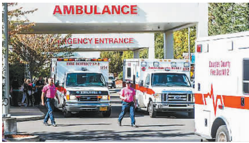
10月1日, 在美国俄勒冈州罗斯堡, 医护人员把枪击事件中的伤者送到医疗中心就医。