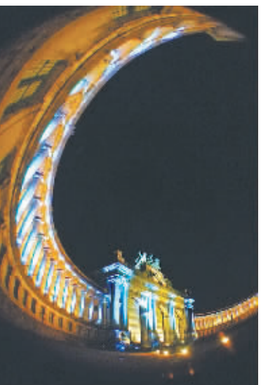
这是10月1日在比利时首都布鲁塞尔拍摄的声光表演现场。

当日, 为纪念两德统一25周年, 布鲁塞尔五十周年纪念公园举行了一场大型声光表演。表演先以一段8分钟的短片回顾了德国及欧洲自二战以来从分裂走向统一的历史, 随后用变幻的灯光和优美的音乐给上万名观众带来美妙的艺术享受。