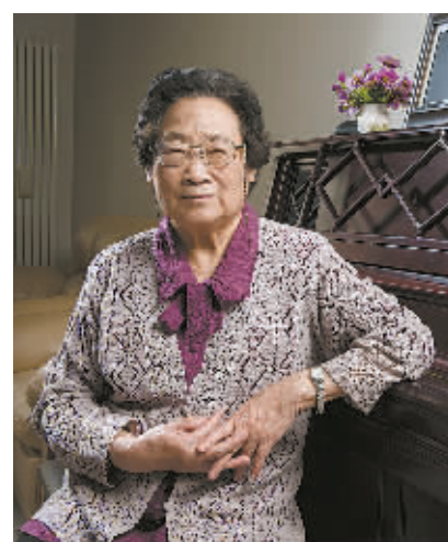
10月6日,屠呦呦在北京的家中。

国家卫生计生委、国家中医药管理局在对屠呦呦获奖的贺辞中表示,屠呦呦的获奖,表明了国际医学界对中国医学研究的深切关注,表明了中