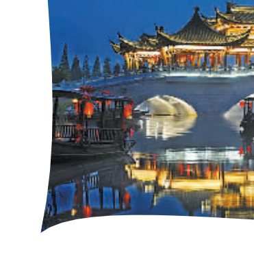
▲滕头村在展示“水韵滕头、夜色滕头”。

对于大学生加入家政服务业，业内人士充满了期待。 近年来，随着政府对家政行业扶持力度的加大，我市家政服务业有了长足发展，但仍处于小、弱、散的阶段，瓶颈之一一是人才匮乏。81890和宁波市家政服务协会的调查数据显示，宁波10万余家政从业人员中，高学历占比不足1%，现在的家政市场上，从业者仍以60后、70后居多，这些从业者认为自己的职业寿命不长，对职业技能培训积极性不高。而据浙江省家政服务人才培养培训联盟的调查显示，全省家政服务人员中，小学及以下文化程度占43.8%，初高中学历占51.7%，专科及以上学历占4.6%。 有家政服务企业负责人表示，现在不少家政企业的领导层，是一线上来的老员工，吃苦耐劳，不足之处在于骨子里的生活习惯制约了家政服务的规范化、标准化的有效执行。“相信这些大学生的加入，会给宁波家政行业带来新气象。”