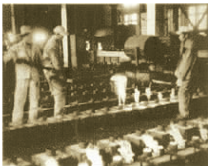
一五期间的宁波动力机厂