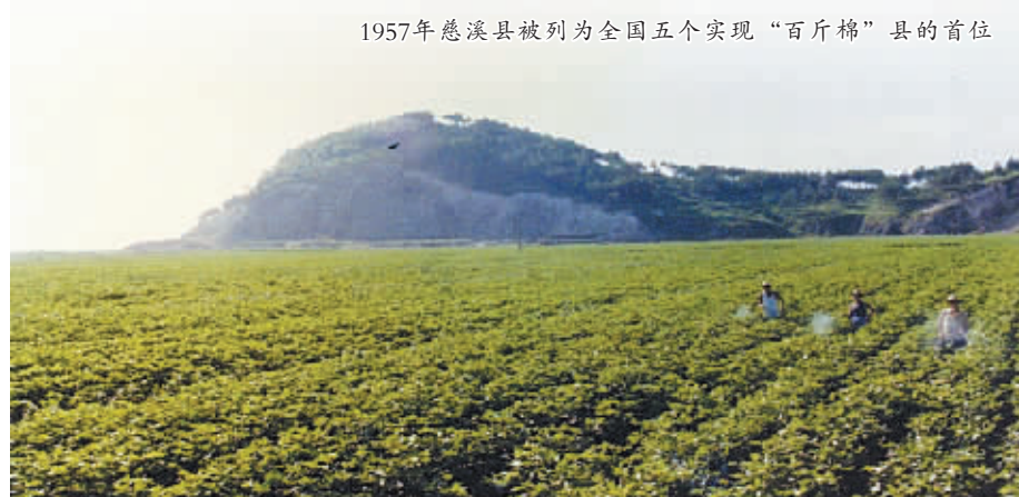
1957年慈溪县被列为全国五个实现“百斤棉”县的首位

1955年11月12日，《人民日报》发表了题为《棉花丰产的慈溪县》一文，指出“合作化是棉花大丰收的主要