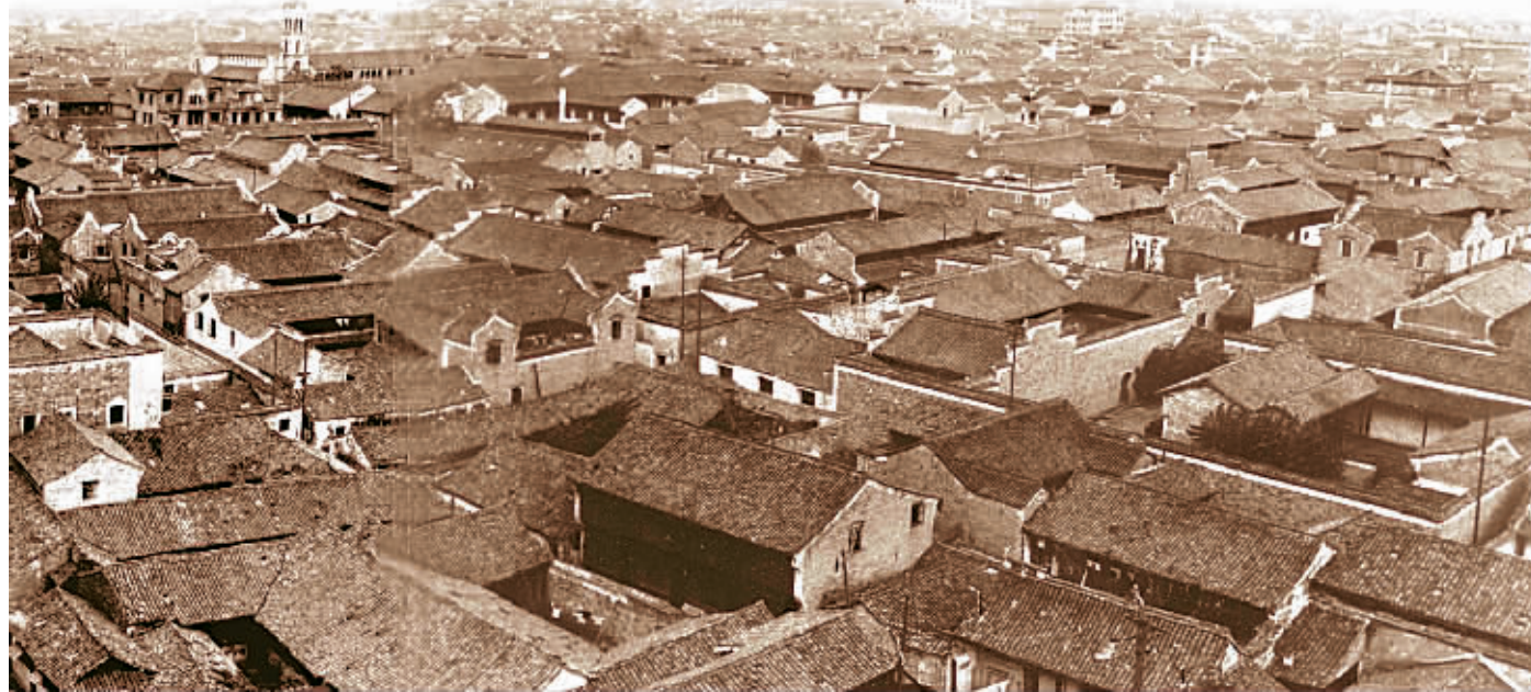
20世纪50年代的宁波市貌