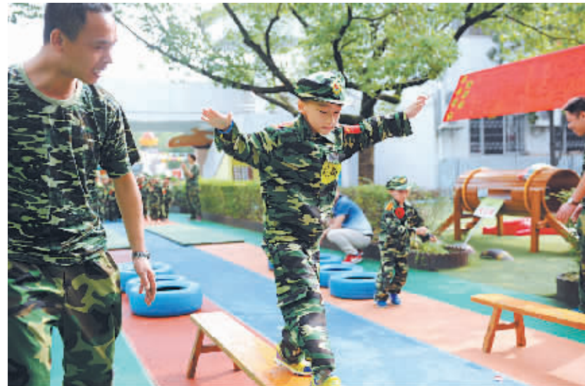
10月9日,余姚市实验幼儿园教育集团富巷园的200多名小朋友,在教官带领下参加了队列训练、唱军歌、叠被子等活动,体验新鲜、充实、紧张的军营生活。