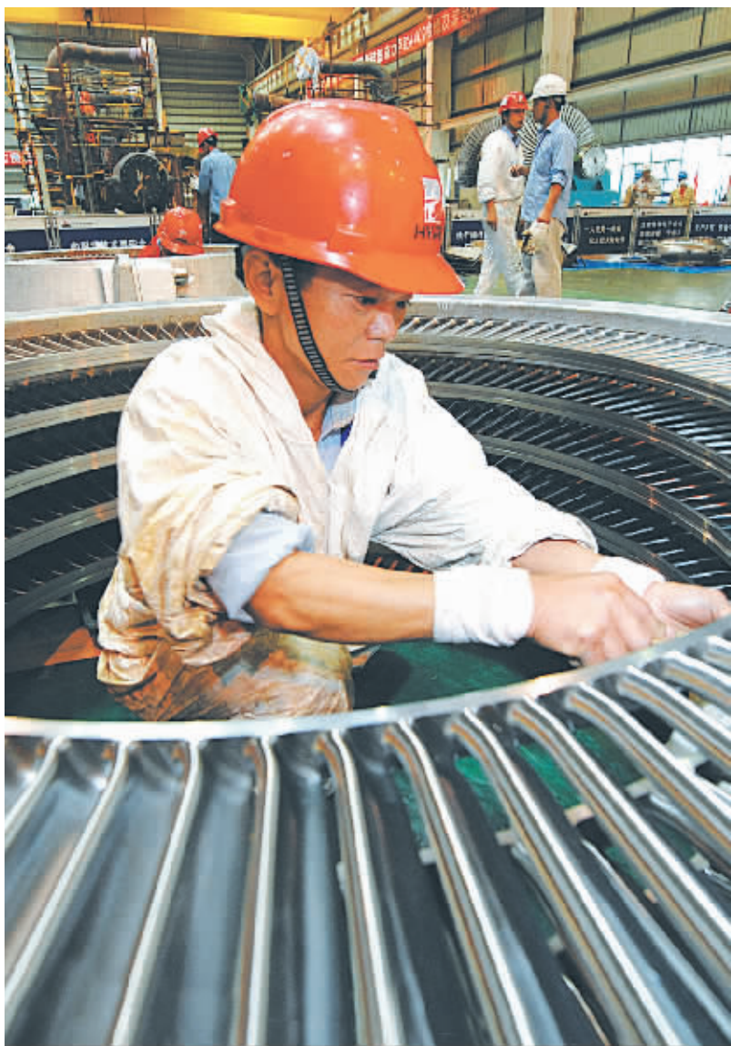
▲国华宁海电厂目前正在投入3.56亿元对4号机组进行节能环保综合升级改造,在推动该区域循环经济发展上发挥龙头作用。

在宁海临港经济开发区内,宁海县长距离集中供热项目正呈现出施工高潮,这个项目将浙江国华宁海发电厂作为热源,为科技园区的热用户提供集中供热。建成后有效消化电厂的余热,大幅降低园区内企业单位产品的煤耗量。