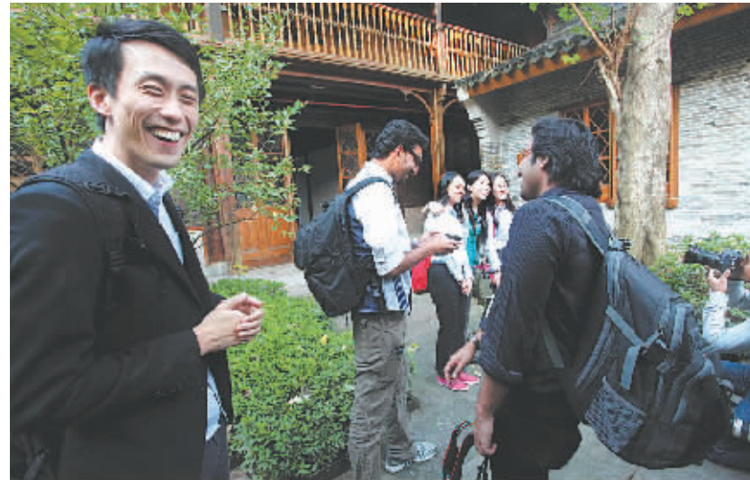
昨天下午,亚洲媒体记者团走进屠呦呦旧居,并纷纷拍照留影。

本报讯(记者余晓辰 王伊婧) 昨天下午,位于海曙区开明街的屠呦呦旧居迎来了一群“海外粉丝”。“屠呦呦荣获诺贝尔生理学或医学奖,不但是宁波人的骄傲,也是亚洲人的荣耀。”来自采风的亚洲媒体记者纷纷掏出相机,和诺奖得主儿时居所合影留念。至此,为期3天的“探海密行程中,记者团参观了宁波博物馆、庆安会馆、高新区、宁波港、老外滩、月湖等地,并参加了人才科技周活动。