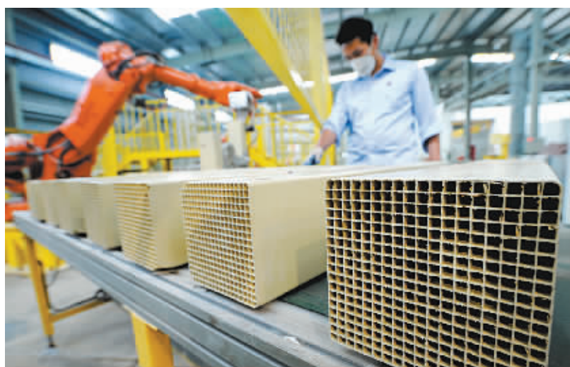
▲总投资4亿元的浙江浙能催化剂技术有限公司脱硝催化剂生产线。

的,围绕电厂废弃物的综合循环利用,配套建立了海螺水泥、北新建材、宏韵建材等企业,构建上下游产业间资源综合利用的循环经济产业链。投资4亿元的“浙能”脱硝催化剂项目、投资4.5亿元的“浙能”电厂固废综合利用项目及“巨成铜业”“利伯河竹纤维板”等一