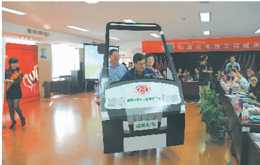
图为清风社区“流动巴士”项目参加望春街道“民生微工程”模拟考。

本报讯(记者陈朝霞 海曙记者站毛一波 通讯员吕辉) 乘上清风社区“流动巴士”其乐融融、借辆西城社区公共自行车方便出行、在青林湾社区“青苗悦读园”快乐阅读……昨天下午,海曙区望春街道13个社区的18个优秀民生“微工程”迎来模拟考,涵盖基础设施建设、便民服务、青少年教育、为老服务等社区生活方方面面的民生工程亮点频频。