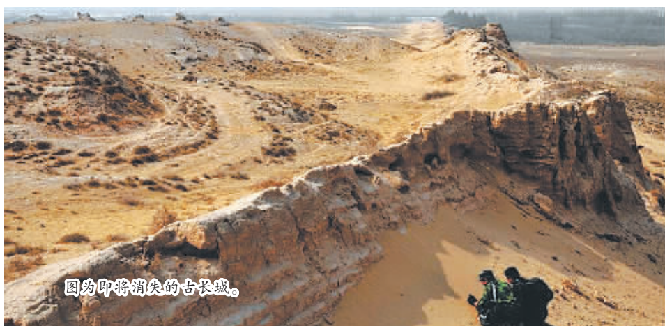
图为即将消失的古长城。

在阳方口段长城，被抓了砖的长城成了一截土墙，外侧几乎被煤渣掩盖。“啥长城？不就是堆土墙嘛！以前为修公路铁路，推倒了一截，剩下的这段成了煤渣场的围墙。”路过的一位村民说。