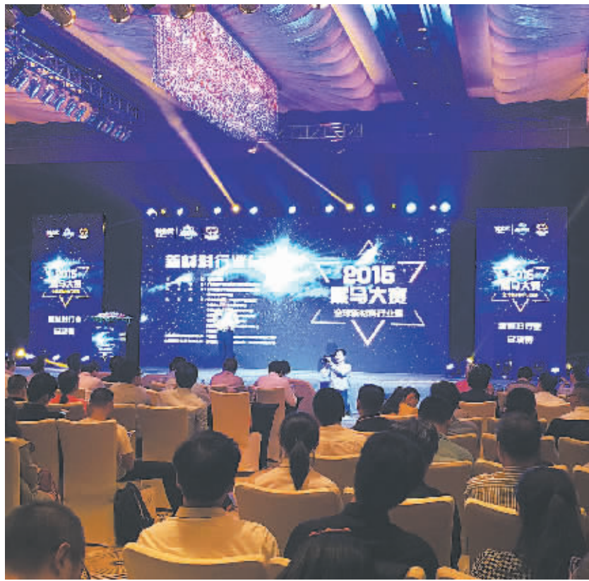
黑马大赛新材料行业大赛前后历时半年，跨越半个地球，观摩人数累计数千人，激发了新材料行业资源的瞬间爆发，大幅推进了宁波新材料科技城的产业集聚进程。图为大赛现场。

参赛现场，美国田纳西州大学化工博士威鸣带来的“过氧系统”项目引得评委的一致好评。“这是专注于双氧水生产的一种新工艺，其特点是