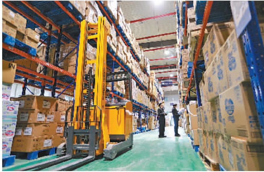
随着一批新的跨境仓陆续投用,今年“双十一”仓储紧张问题有望缓解。

日前,海关总署副署长吕滨在宁波调研时,充分肯定了我市跨境贸易电子商务试点工作,希望宁波把跨境电商作为外贸新的经济增长点来着力打造。