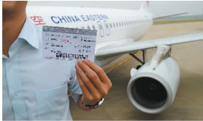
宁波飞北京的客源经年不衰。