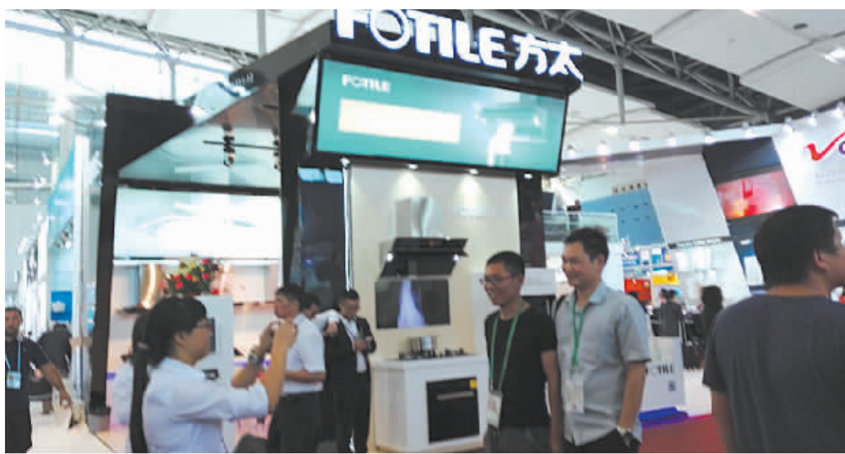
图为广交会上宁波制造受到各路客商青睐。

值得一提的是,我市诺康德医疗科技有限公司的塑料轮椅荣获本届CF奖银奖。几天来,已有多名外国客