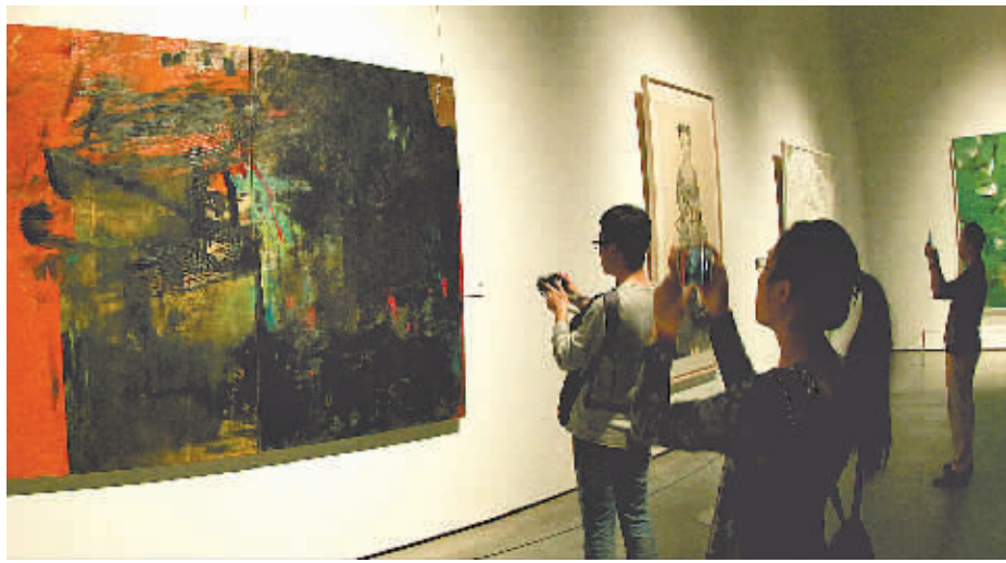
市民在宁波市美术馆观赏综合材料绘画作品。

昨天展出的这些远看像是水墨、油画、版画、漆艺、装置的作品,通过近距离观察,才能发现它们使用了不同的创作材料和创作手法,如杜华《印象水墨》、王来文《香自远》等类型作品,兼具传统性和现代性。有的艺术家在表达内在情感时,通常选择与之对应的视觉精神性的材质,如方达成将破旧的铁皮,经过拼贴、焊接以及腐蚀等手段,创作出巨幅作品《焚天卡夫卡》,散发出一种令人震撼的张力……徐里认为,这些作