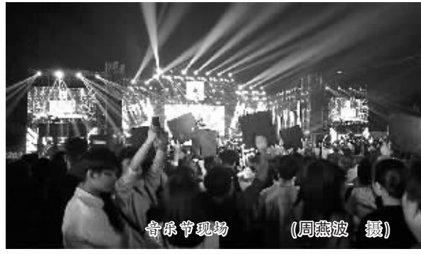
音乐节现场

阿拉音乐节今天晚上还有一场，届时韩国著名M&D组合(金希澈&金政模)和台湾歌手汪东城和曾沛慈、《中国好歌曲》刘欢组学员杨含奇&Soulshine乐队、蘑菇菌等重要歌手、乐团将陆续亮相。