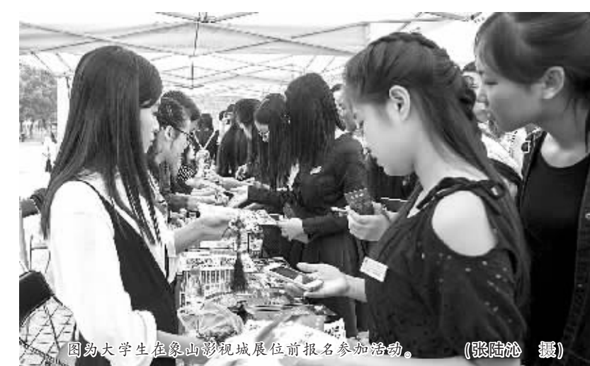
图为大学生在象山影视城展位前报名参加活动。

本报讯(通讯员陈晚桦 吴宙洋 记者沈晔 南华)“我要去走梅长苏走过的甬道，去靖王府圆我的靖王妃之梦……”23日，在浙江大学宁波理工学院举行的2015首届宁波大学生旅游节上，象山影视城推出的看《琅琊榜》游影视城精品线路，受到大学生粉丝的热捧。