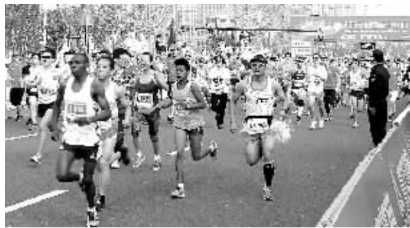
昨天，2015宁波国际马拉松赛在宁波杭州湾新区鸣枪开跑。图为比赛现场镜头。