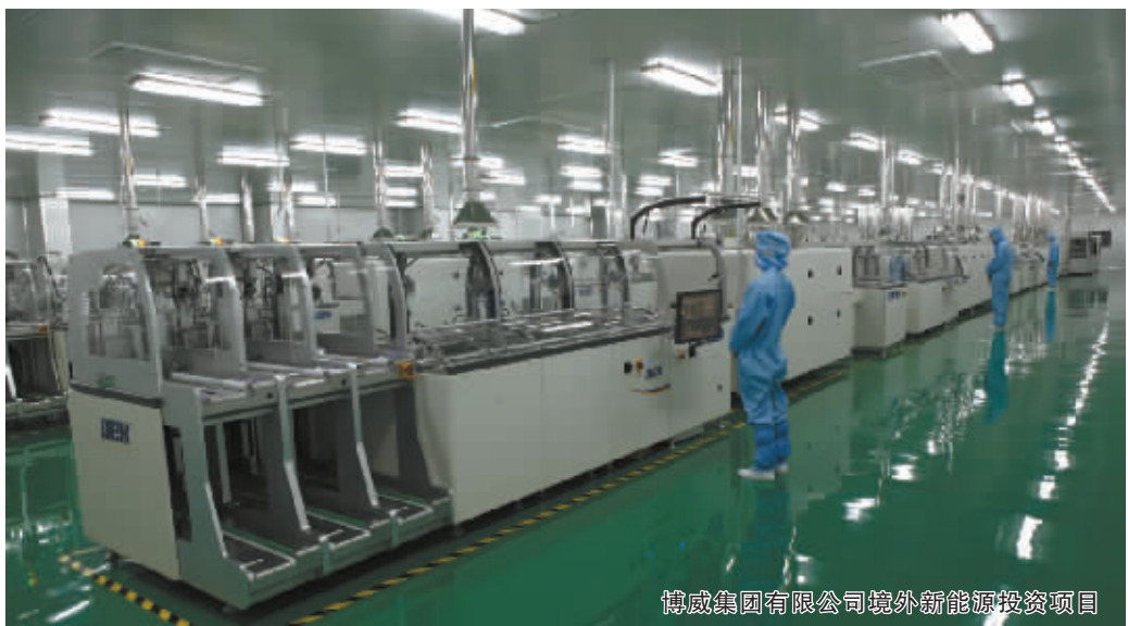
博威集团有限公司境外新能源投资项目

中国进出口银行宁波分行 THE EXPORT-IMPORT BANK OF CHINA NINGBO BRANCH