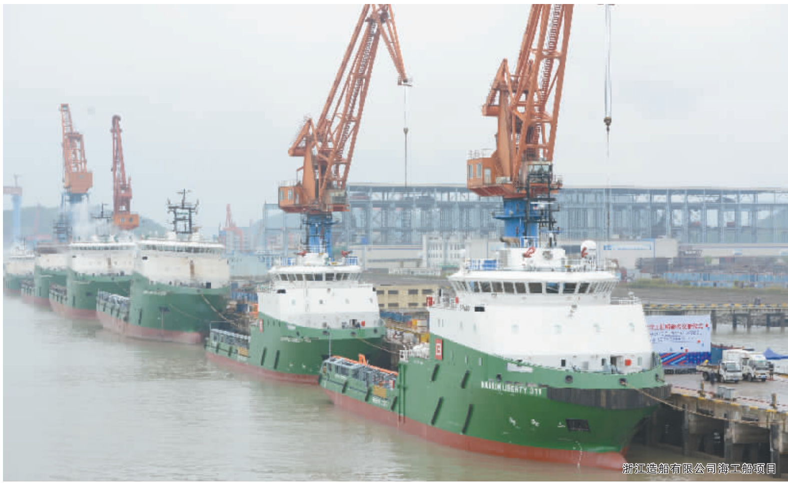
浙江造船有限公司海工船项目

数字的变化见证了可喜的业绩。几经风雨，一路前行，中国进出口银行宁波分行在宁波市委、市政府的大力支持下，认真贯彻落实国家宏观经济政策，积极践行“忠诚奉献 诚信严谨 开放包容 开拓创新”的核心价值观，主动提高金融服务意识和水平，创新业务模式和信贷产品，不断加大全市进出口企业、重大项目、中小企业、民生等领域的贷款投放力度，有力支持了地方经济建设和社会发展，同时也迎来了自身的发展壮大，成为宁波开放型经济和社会发展的金融重要机构。