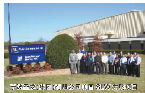
宁波圣龙(集团)有限公司美国SLW并购项目

——支持宁波企业“走出去”。截至2015年9月末，宁波分行支持“走出去”贷款余额达15.63亿元，项目涉及欧、亚、北美、拉美四大洲及英国、越南、美国等6个国家（地区）。重点支持了雅戈尔集团股份有限公司、宁波劳伦斯汽车内饰件有限公司、宁波圣龙（集团）有限公司、宁波春和钾资源有限公司等企业，涉及纺织服装制造、汽车零部件及配件制造、采矿等行业。