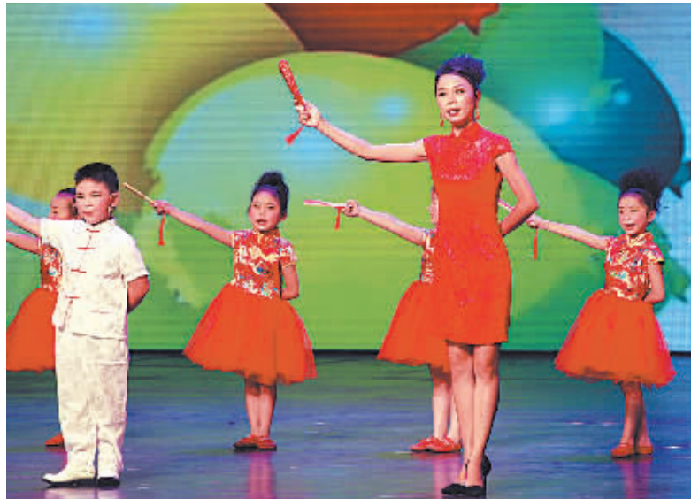
图为小朋友们在表演蛟川走书《换弟弟》。

“小淘气，小淘气，奔上跳落来不及，跌跌下卜忙勿停……”朗朗上口、充满童趣的书词，活泼生动的演唱，这是蛟川街道中心幼儿园的教师作词，著名曲艺音乐人刘海涛作曲的新蛟川走书曲目《小淘气，了不起》。“因为采用了方言童谣，孩子们接受程度很高，如今这首曲子幼儿园的小朋友都会唱，如同我们的园歌。”孙旭霞说，为了能更好地传承蛟川走书，幼儿园开展“方言童谣我来念”“蛟川走书你来唱”及“蛟川走书我来演”的活动，运用多种形式的教学方法让孩子们在趣味中体验方言童谣的内涵、感受方言童谣带来的