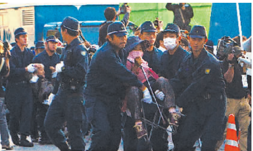
10月29日，在日本冲绳县名护市，警察转移在美军基地施瓦布营门口抗议的民众。

新华社供本报特稿(陈立希)日本政府29日上午启动驻日美军普天间基地“新址”边野古沿岸的主体工程。抗议民众占道静坐，阻止装载材