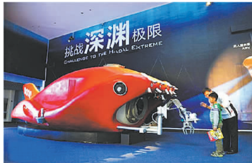
图为“彩虹鱼”号模型。

据新华社上海10月29日电(记者张建新)记者从上海海洋大学29日召开的新闻发布会上获悉，该校研制的我国首台万米级无人潜水器和着陆器“彩虹鱼”号在南海成功完成4000米级海试，这标志着中国人探秘“万米深渊”计划迈出了实质性的第一步。