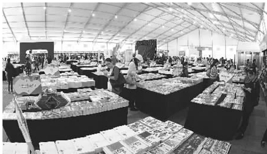
读者在宁波书展挑选展出的书籍。

带着孩子和书单前来寻觅觅觅,亲朋好友结伴聆听作家讲宁波帮、晚明风雅人士;体验移动图书馆带来的数字化阅读……汇集了全国118家参展出版单位的2015宁波书展昨日在文化广场开展,3万余种图书在4000平方米的展厅内让爱书人大呼惊喜,“宁波终于有了自己的年度书展,不管大家买不买书,都为书香宁波增添了浓浓的氛围!”