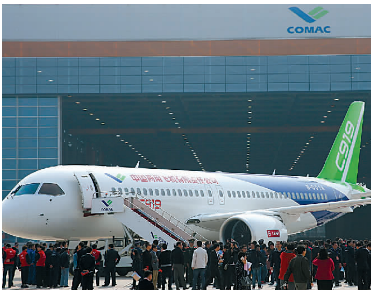
11月2日，C919首架机停在总装制造中心浦东基地厂房外。