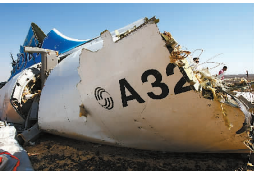
这是11月1日在埃及西奈半岛拍摄的俄罗斯失事客机残骸。

据新华社北京11月2日电 俄罗斯总统普京2日表示，要尽一切努力客观还原在埃及西奈半岛坠毁的俄罗斯客机失事真相，以使俄方能够作出相应回应。与此同时，围绕客机失事原因的表态众说纷纭，俄罗斯有关方面对此表示，尚不排除任何一种失事可能性。