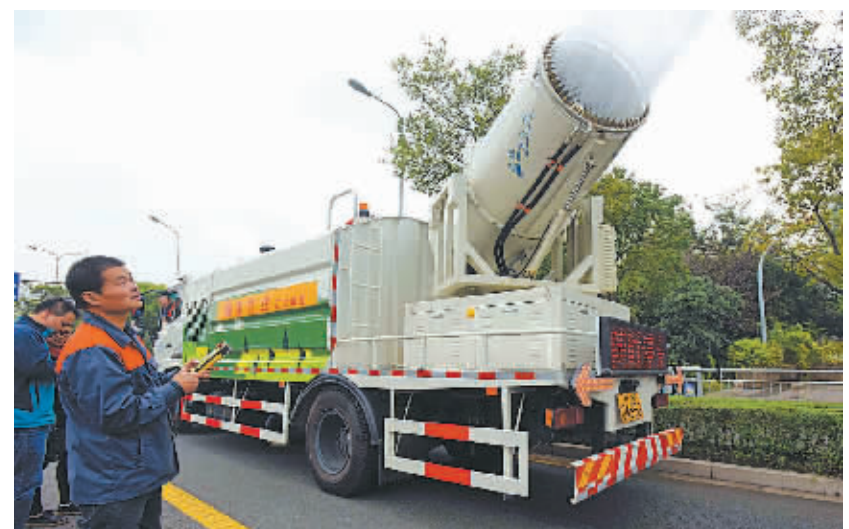
图为“多功能抑尘车”正在马路上进行降尘作业。